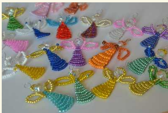
Překvapení od rodiny Frgálových - malí korálkoví andílci. Děkujeme!